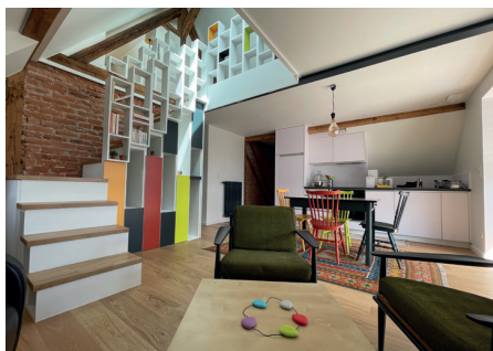
Alchimy – Rénovation et extension d'un immeuble – Colmar (68)