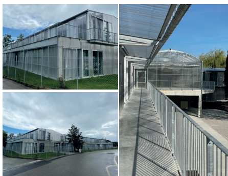
Architectes : LACATON et VASSAL - BALLAST 18 logements HLM – Rixheim (68)

CONSTRUIRE ET RÉNOVER, ENTRE CRÉATIVITÉ ET DURABILITÉ